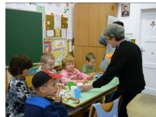
tízórai a negyedikeseknél

KEDD: Közösén készítettük el az ajándékot az elsősöknek, hiszen másnap újra indultunk az iskolába.