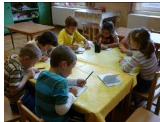
ballagó évkönyv kiszínezés