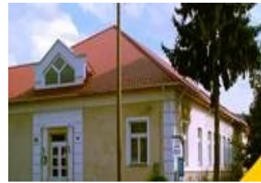
Általános Iskola, Kaposfő