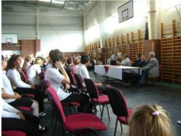
Verset mondanak az elsősök

Az évnyitó után visszakíséri az elsősöket a tanterembe és sok sikert kíván az iskolai élethez!