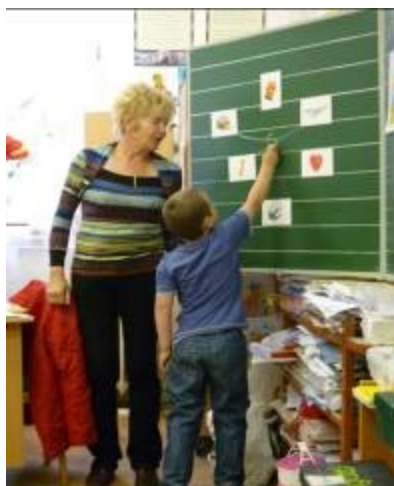
Hol hallod a hangot?